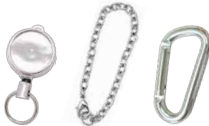
リールキーホルダー バッグチェーン カラビナ