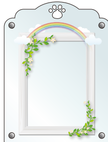
カプセル掛け無しタイプ