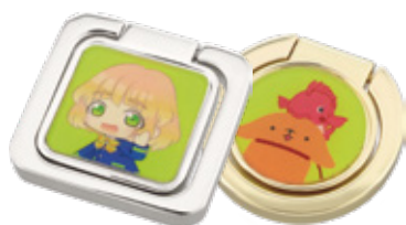
アニメ・キャラクター