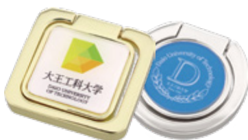
校章・ロゴ・エンブレム