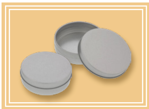
ブリキ缶 φ73mm 浅

材質：ティンフリースチール (シルバー色 / 梨地) 蓋：スライド式 オススメ封入物…ステッカー、ヘアピン、アクリルチャーム、イヤリング、ラムネ※2 ほか