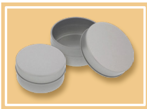
ブリキ缶 φ73mm 深